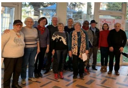
La chorale à la Résidence autonomie Le Cèdre à Nogent