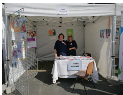
Nogent sur Marne

Afin de rencontrer les personnes se posant des questions concernant la maladie d'Alzheimer, l'association a été présente dans plusieurs villes lors des forums :