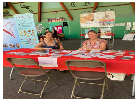
Bry sur Marne